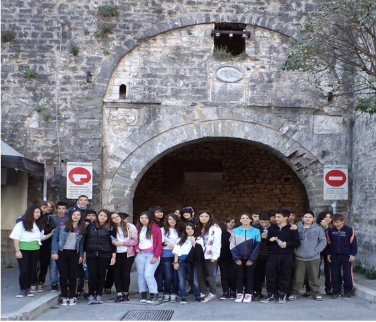
Εικόνα 1: Το Β2 μπροστά στην πύλη του κάστρου των Ιωαννίνων.