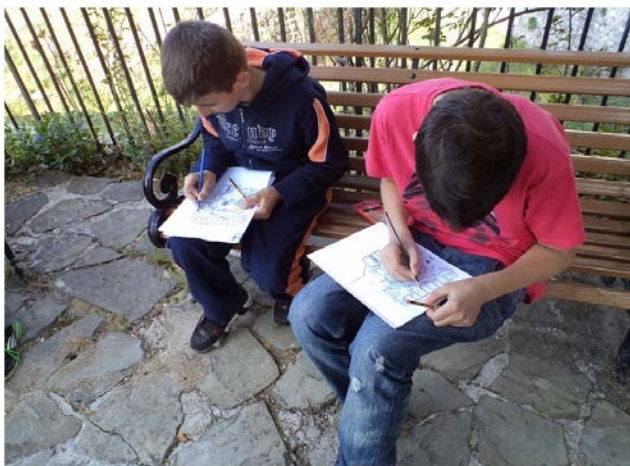
Εικόνα 4. Οι μαθητές εν ώρα εργασίας.

Σε τρίτη φάση, στο σχολείο, οι μαθητές παρουσίασαν αντικείμενα της καθημερινής τους ζωής, προερχόμενα από την οικογενειακή τους παράδοση.