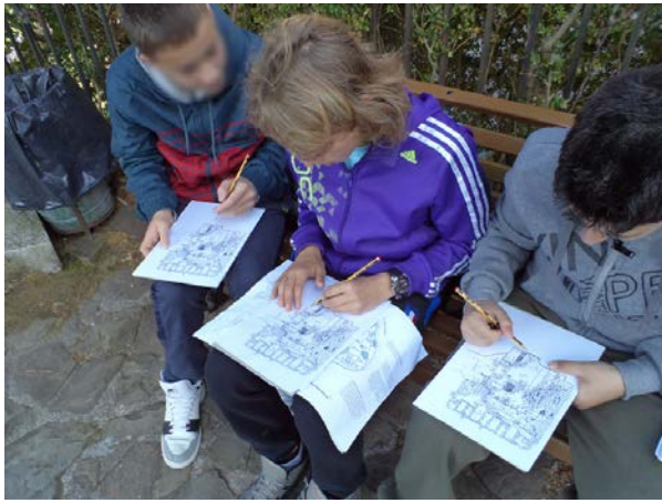
Εικόνα 3. Οι μαθητές εν ώρα εργασίας.