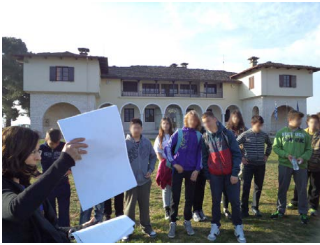
Εικόνα 2. Προετοιμασία δραστηριότητας μπροστά στο Βυζαντινό Μουσείο Ιωαννίνων.