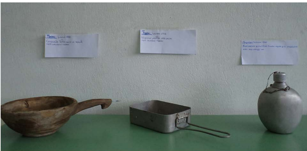
Εικόνα 7. Έκθεση με οικογενειακά κειμήλια των μαθητών στο «Μουσείο του σχολείου».